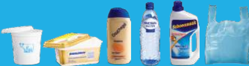
ΠΛΑΣΤΙΚΑ ΜΠΟΥΚΑΛΙΑ, ΔΟΧΕΙΑ ΚΑΙ ΣΑΚΟΥΛΕΣ