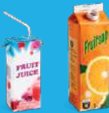
ΣΥΣΚΕΥΑΣΙΕΣ ΤΥΠΟΥ ΤΕΤΡΑ ΡΑΚ