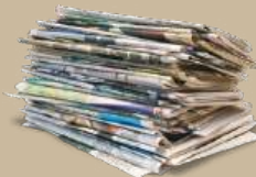
ΕΦΗΜΕΡΙΔΕΣ - ΠΕΡΙΟΔΙΚΑ