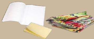
ΔΙΑΦΗΜΙΣΤΙΚΑ - ΧΑΡΤΙ ΓΡΑΦΕΙΟΥ